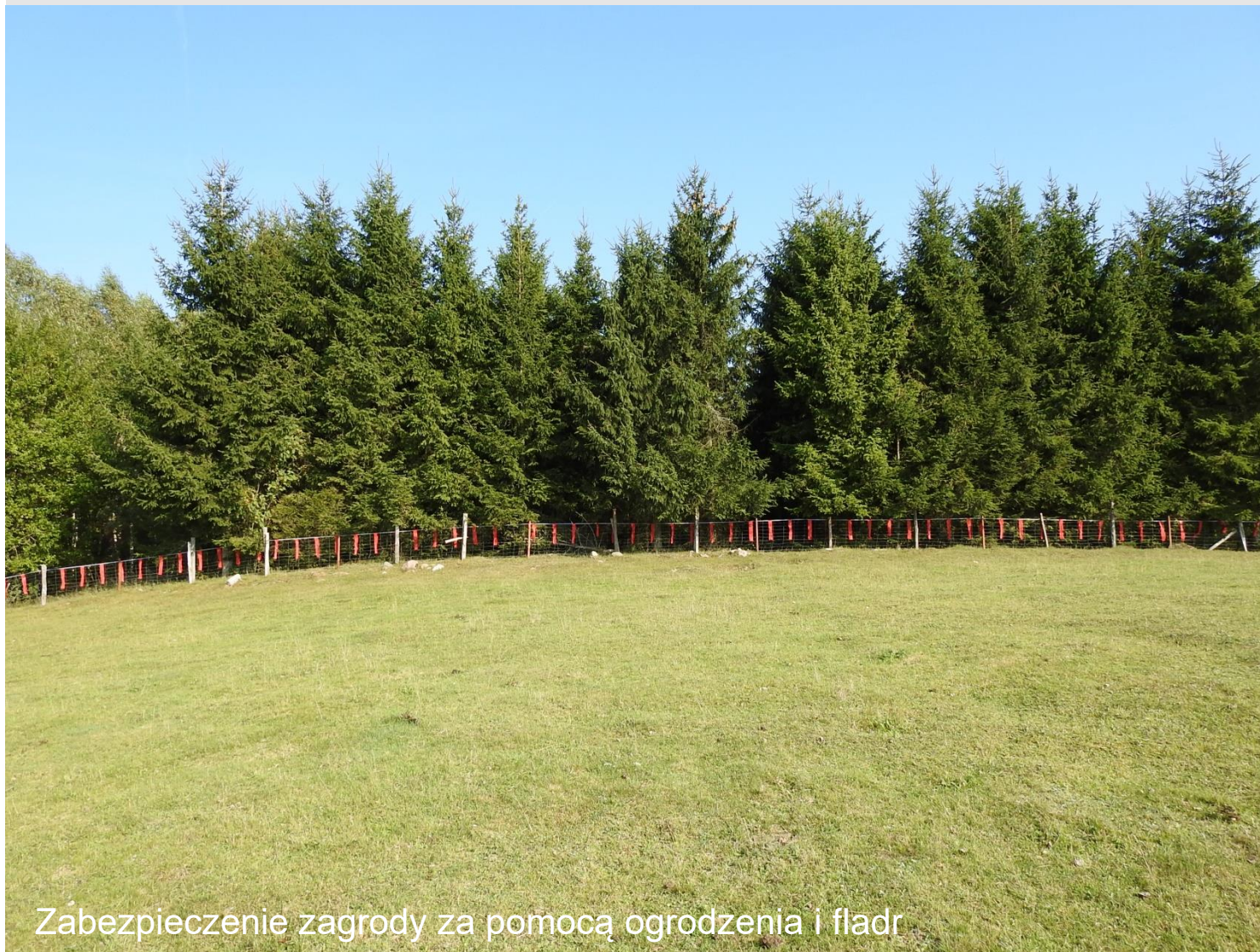
Zabezpieczenie zagrody za pomocą ogrodzenia i fladr