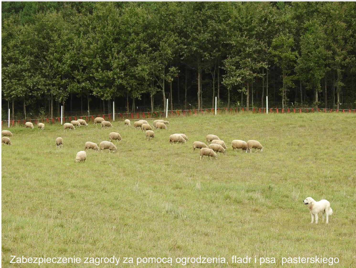
Zabezpieczenie zagrody za pomocą ogrodzenia, fladr i psa pasterskiego