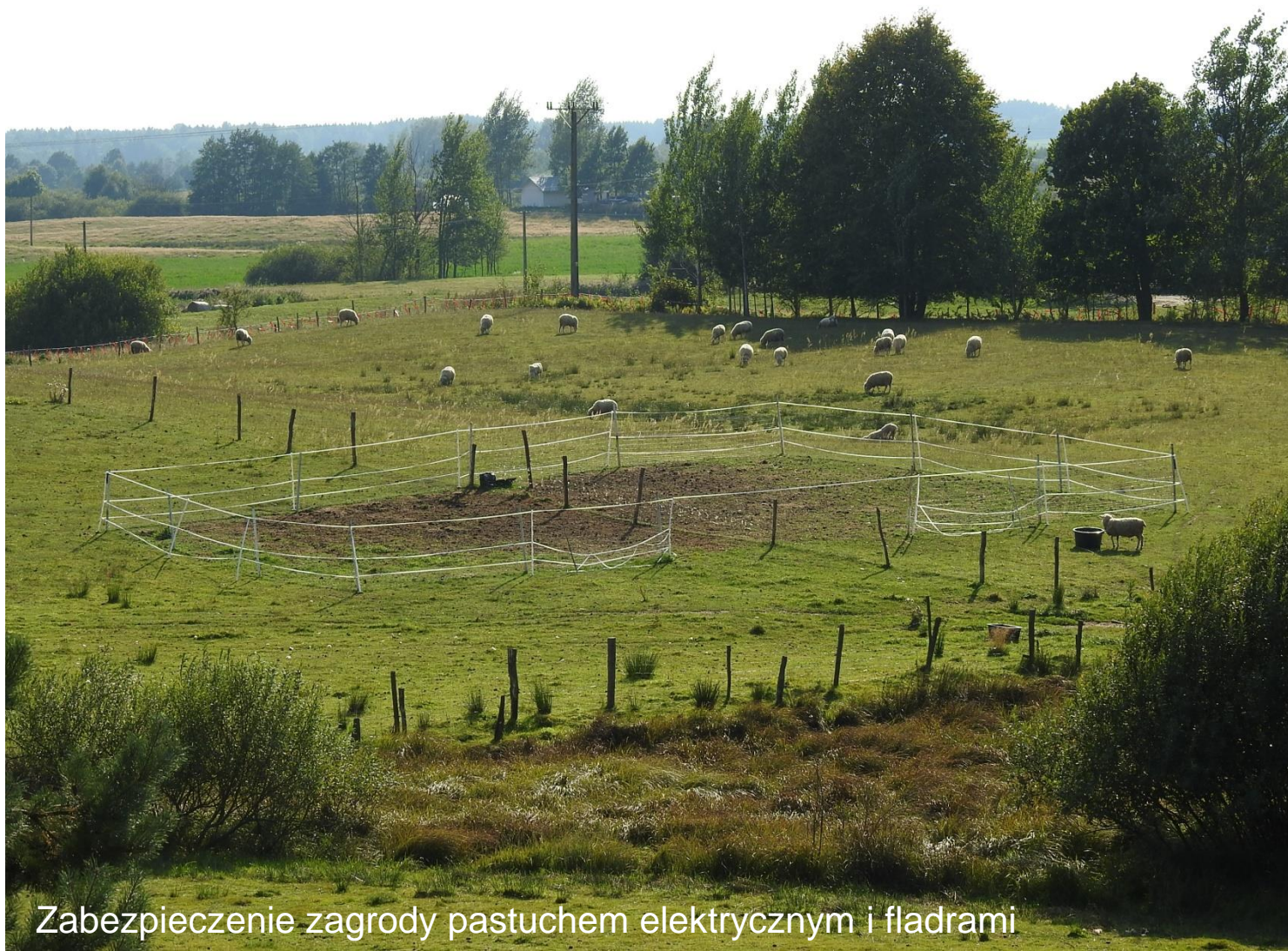
Zabezpieczenie zagrody pastuchem elektrycznym i fladrami