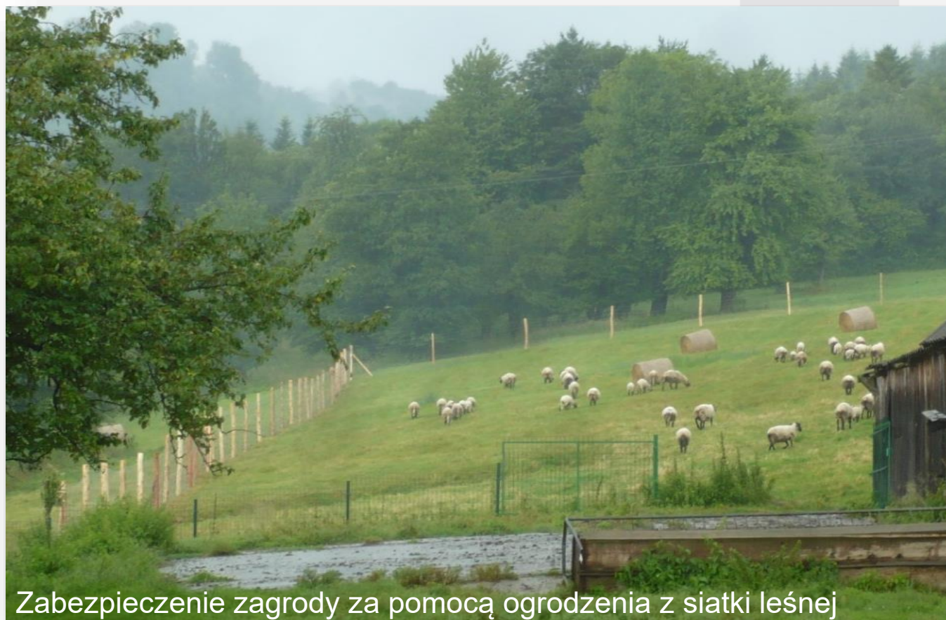
Zabezpieczenie zagrody za pomocą ogrodzenia z siatki leśnej