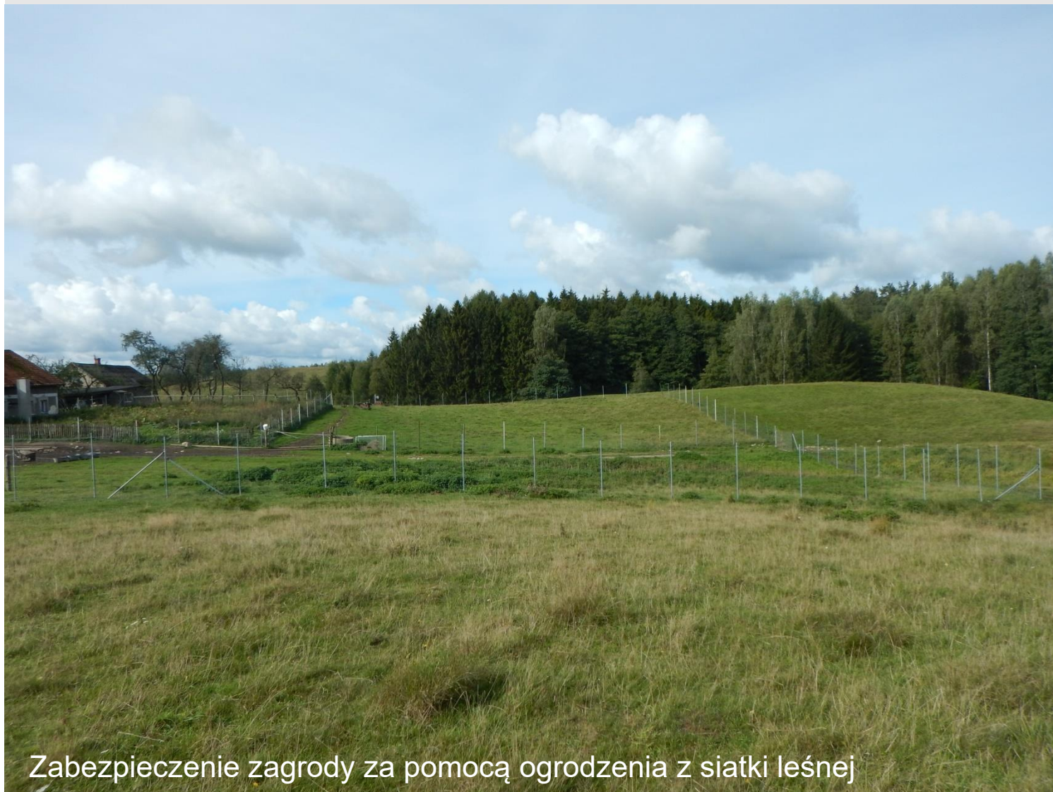
Zabezpieczenie zagrody za pomocą ogrodzenia z siatki leśnej