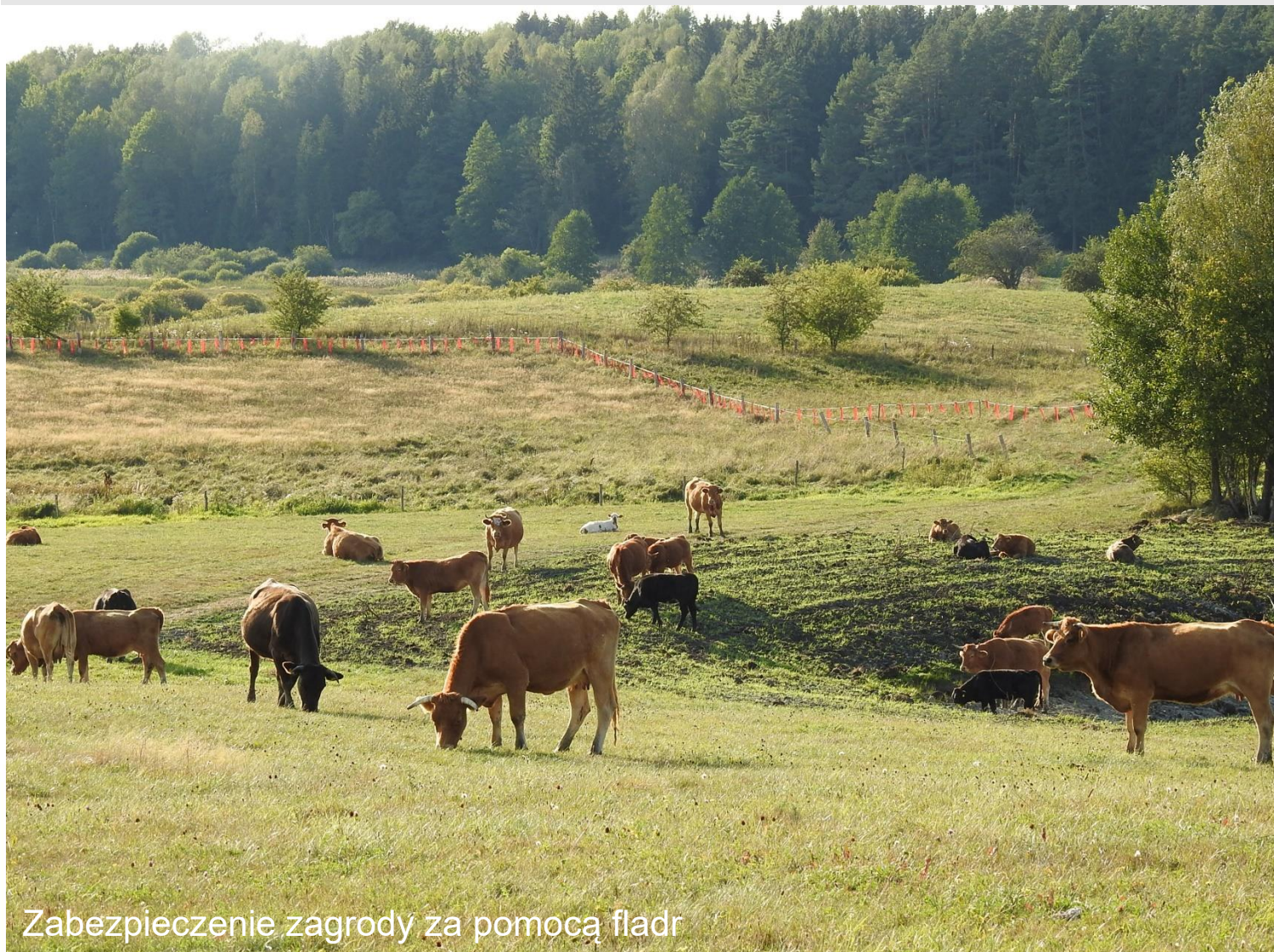
Zabezpieczenie zagrody za pomocą fladr