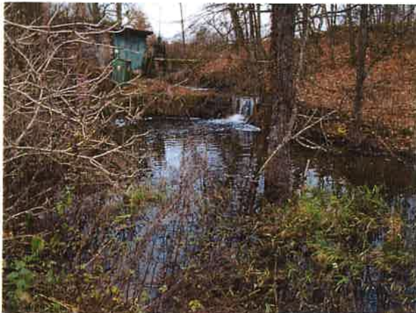
Fotografia nr 17. Pozostałości po byłym młynie wodnym w Żabinie