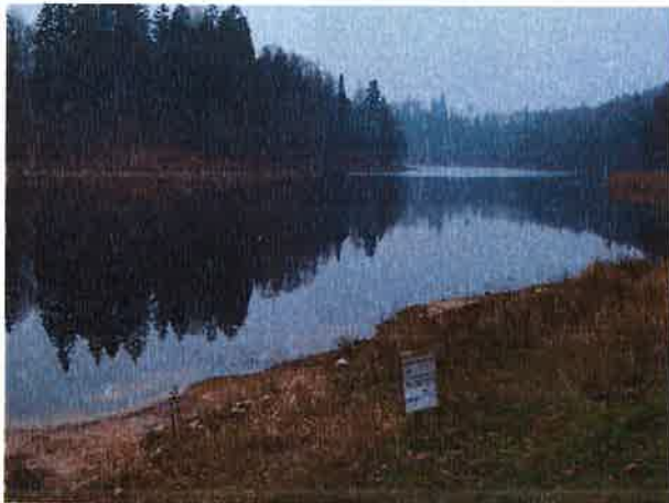
Fotografia nr 28. Widok na zachodnią część jeziora

Powierzchnia jeziora ok. 13.5 ha. Położone wśród zalesionych Wzgórz Klewińskich na północ od miejscowości Gryżewo. Wschodni brzeg jest bardzo stromy, podnoszący się około 50 m nad wodę. Długość jeziora 860 m, szerokość 180 m, maksymalna głębokość 13.2 m. Dzierżawcą jeziora jest osoba prywatna. Obowiązuje zakaz wędkowania z łodzi.