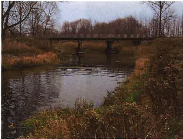
Fotografia nr 5. Starorzecze Węgorapy. Most na drodze Mieduniszki Małe – Mieduniszki Wielkie