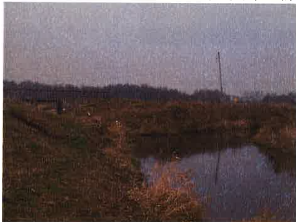
Fotografia nr 18. Miczuły. Początek Kanału Brożajckiego (w prawo), po lewej stronie fotografii – jaz rozrządowy

Kanał łączy rzeki Gołdapa i Węgorapa. Został zbudowany w 1720 roku. Bierze początek na wysokości 16,7 km Gołdapy i wpada do Węgorapy w jej 98,2 kilometrze w miejscowości Brożajcie. Pełni on funkcję kanału ulgi dla przepływu wód rzeki Gołdapy w jej dolnym biegu przede wszystkim w okresie letnim, gdy występuje zjawisko tzw. „wielkiej wody letniej”. Stereowanie przepływem odbywa się na jazie rozrządowym w Miczułach. Koryto kanału ma maksymalną przepustowość 23 m 3 /s. Na całej długości kanału umieszczone jest pięć budowli piętrząco-upustowych. W Brożajciach znajduje się mała elektrownia wodna wykorzystująca na swoje potrzeby przepływ wody w Kanale Brożajckim. Długość kanału wynosi 7,56 km.