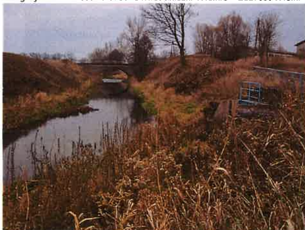
Fotografia nr 2. Most i śluza w Mieduniszkach Wielkich