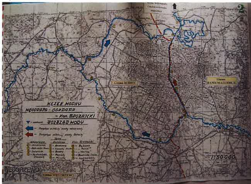
Mapa nr 2