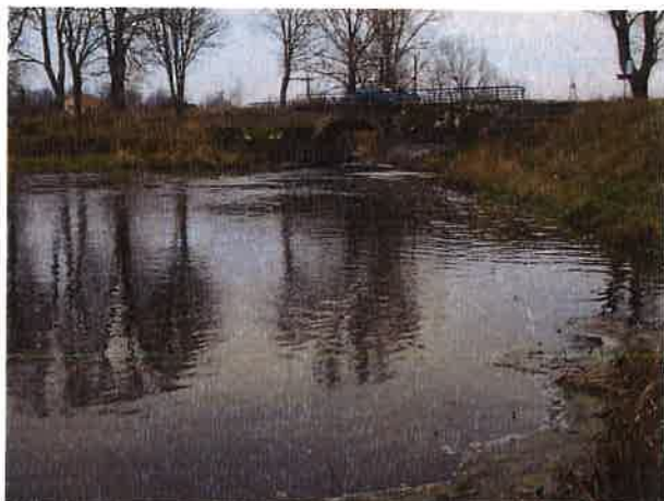
Fotografia nr 3. Widok z mostu w Mieduniskach Wielkich