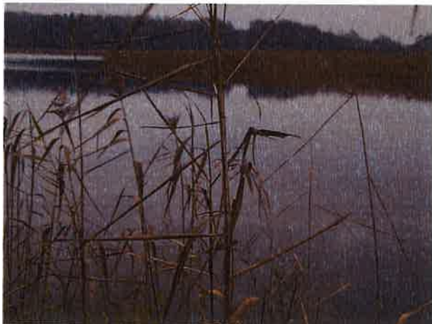
Fotografia nr 29. Widok na południową, „polską” część jeziora

Powierzchnia jeziora 21,67 ha, z czego jedynie ok. 5 ha należy do Polski. Położone na północ od miejscowości Żabin. Grunty przylegające do linii brzegowej należą do osób prywatnych. Dzierżawcą jeziora jest osoba prywatna.